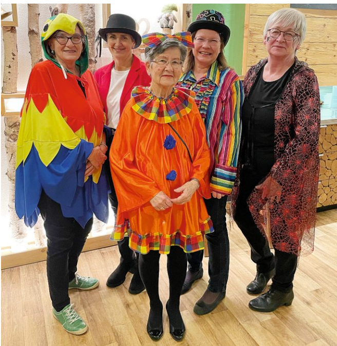
Die Vorstandschaft des Frauenbundes

Die feiernden Frauen waren begeistert und wünschten sich für das kommende Jahr eine Neuauflage des Weiberfaschings.